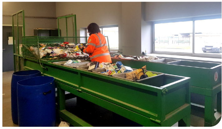
Agent triant des contenus de bacs jaunes lors de l'opération de caractérisation

Nos poubelles d'emballages recyclables sont passées à la loupe une fois par mois. De quoi s'agit-il exactement ? Lorsque le camion de collecte ramasse les bacs à couvercle jaune, 50 kilos sont extraits du camion et triés afin de connaître les pourcentages des différents matériaux recyclables présents dans nos poubelles. Cette étude permet aussi d'analyser et comptabiliser les erreurs de tri. Ainsi, nous savons que parmi les objets indésirables, du verre, des textiles sont régulièrement mis au tri. Ces erreurs de tri sont extrapolées en fonction du tonnage mensuel que nous envoyons au centre de tri et nous sont ensuite facturées. Ce sont 24 % (en poids) de nos bacs de tri qui ne sont pas conformes et ils entraînent un surcoût annuel de 66 000 euros directement imputables à la redevance déchets. Notre vigilance est donc essentielle. Au moindre doute, n'hésitez pas à consulter les consignes de tri présentes sur les emballages que vous jetez ou sur l'application «triercestdonner».