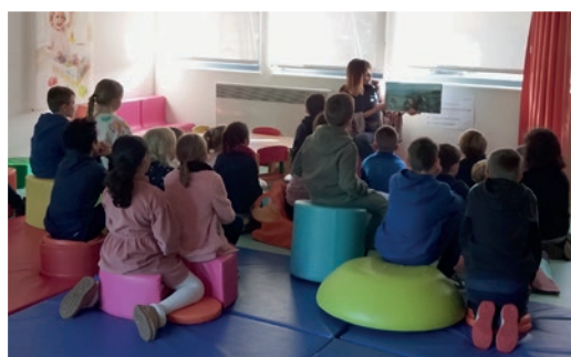
La lecture d'histoires, moment particulièrement apprécié par les élèves

La programmation culturelle de 2024 réserve son lot de réjouissances pour les usagers de Ludibulle. Les bébés lecteurs un lundi par mois et les ateliers