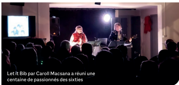
Let it Bib par Carol Macsana a réuni une centaine de passionnés des sixties